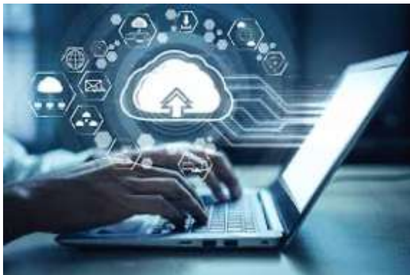
J, I. o. A. G. (s. f.). SOFTWARE INTELLIGENCE & TI SOLUTIONS. SOFTTIS.

Por último, las organizaciones ilegales han desarrollado y evolucionado sus formas de lavar activos, actualmente hay cerca de 50 paraísos fiscales en el mundo y hay una mitendencia de que aparezcan más en el régimen mundial, las autoridades mundiales han detectado el uso de estas zonas para actividades ilegales, por lo que los grupos ilegales han cambiado de métodos para el presente y futuro