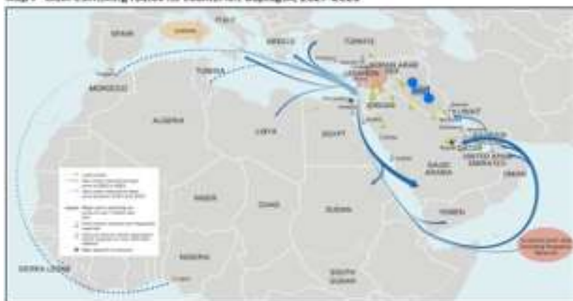
Map 1 Main trafficking routes for counterfeit Captagon, 2021-2023

(«Drug Trafficking Dynamics Across Iraq And The Middle East», 2024) https://www.unodc.org/documents/data-and-analysis/Iraq/Iraq-regional_dynamics_report_2024.pdf