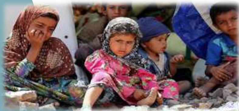
Imagen 1: Com. tr. Recuperado el 15 de junio de 2024, de https://cdnuploads.aa.com.tr/uploads/Contents/2018/04/11/thumbs_b_c_652b5a405f774a50535a1fcd6fb3b21d.jpg?v=030139

Además, UNICEF ha contribuido a la creación de normas internacionales que protegen a los menores de la explotación, la violencia y la discriminación a lo largo de las décadas. La creación de los Objetivos de Desarrollo Sostenible, que buscan garantizar el bienestar y la equidad para todos los niños en el mundo, se basó en su trabajo. "No hay causa que merezca más alta prioridad que la protección y el desarrollo del niño, de quien dependen la supervivencia, la estabilidad y el progreso de todas las naciones y, de hecho, de la civilización humana" (Nations, U. (n.d.). Cumbre Mundial en favor de la Infancia | Naciones Unidas. United Nations. https://www.un.org/es/conferences/children/newyork1990 )