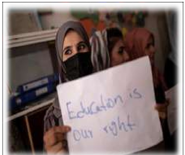
(Los Derechos Humanos de las Mujeres y Niños En Afganistán: Un Antes y un

Factores como el daño contra instituciones educativas, se convierte en un aspecto grave que limita, de muchas maneras, el desarrollo de los programas escolares mundiales y el acceso a estos servicios. En muchos países y dependiendo de la gravedad del conflicto, se puede suspender un derecho tan primordial como lo es la educación por periodos de tiempo indeterminados, que llevan a que los niños se atrasen en sus estudios, estén en un ambiente hostil y violento, y hasta vean en riesgo su integridad de vida. De acuerdo con UNICEF los niños afganos viven en constante miseria y violencia “Solo alrededor del 60% de los niños afganos están escolarizados hoy en día. Entre los adultos el 28% de la población esta alfabetizada” (Niños De Afganistán - Humanium, 2019)