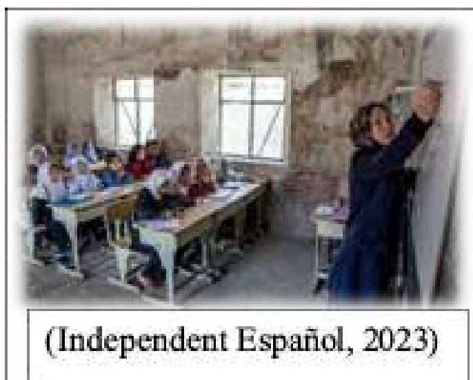
(Independent Español, 2023)

También, actualmente Afganistán es uno de los países más afectados por el cambio climático, el cual trae problemas de salud y forma de vida preocupantes para los civiles. En especial en el sector de la salud y nutrición, donde más de “1.000 personas, en su mayoría mujeres y niños, perdieron la vida en terremotos; 21.000 viviendas quedaron destruidas”. Así mismo, la educación se vio aún más afectada el 23 de marzo de 2022, “1.1 millones de niñas de la enseñanza secundaria no pueden asistir a la escuela hasta nuevo aviso” (Afganistán | UNICEF, s. f.) Para finalizar, UNICEF ha tomado acción y como respuesta decidida utilizar sus equipos y ubicar 13 oficinas operativas donde llevarán ayuda humanitaria a los más vulnerables y necesitados ante este conflicto. Dándoles acceso a servicios básicos de calidad como la salud, nutrición, protección de infancia, agua y saneamiento.