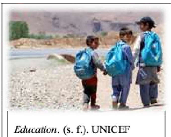
Education. (s. f.). UNICEF

Las niñas en especial que son las que se ven más afectadas en este conflicto. Por esto, se han hecho diversas protestas y manifestaciones en las principales ciudades, negándose a renunciar a su derecho a la educación. Adicionalmente han organizado ayudas humanitarias y donaciones para garantizar la seguridad y reconstruir las instituciones afectadas. De acuerdo con la ONU, “29 millones de personas necesitan de ayuda humanitaria, de los cuales 12,9 millones son niños” (Afganistán | UNICEF, s. f.). Siendo de gran impacto social al ser uno de los países con las peores condiciones de vida para los niños en todo el mundo. Además, se ve aún más afectado por el hecho de que, en el 2023, se prohibió a las afganas para trabajar en Organizaciones de las Naciones Unidas (ONG), trayendo desastrosas consecuencias para las mujeres en Afganistán.