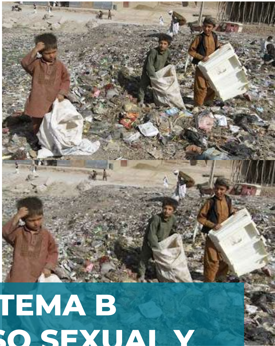
IMAGEN 1: (S/f). Coogjeusercontent.com. Recuperado el 2 de septiembre de 2024, de https://ihs.googleusercontent.com/proxy/c5o26oi2Krp0p4masvwy1vtxyrc1MpsVscZZC8rtEWA5QWcM4ul.F0JIIIWux1Va_xiOedtcbHGjCOTv0yZ0BqC_0jNZ5C6grJIAw8lS_nMwPHzPunLURShNkxHxkYqIEagyTb8tV7KB-0jFTTID3kT5IMP5xcvAD2